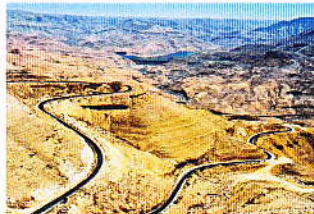
Aux confins du Royaume latin de Jérusalem. Les Croisés au désert