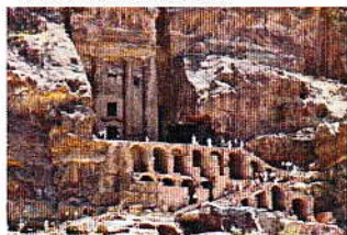
Petra Le sacrifice de l'agneau des Hébreux