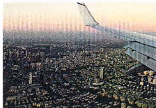
Repartir en témoins d'espérance « Allez par toute la Terre, annoncez l'Évangile aux Nations ! »