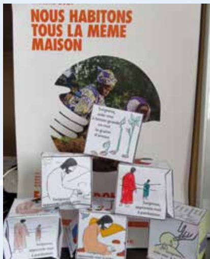
Tirelire confectionnée par les enfants du caté pendant le carême

Les premiers acteurs de l'initiation chrétienne des enfants sont les parents. Pour les y aider, le diocèse de Lille forme toute personne qui a envie de transmettre sa foi – ce à quoi nous sommes tous appelés par notre baptême. Dans notre paroisse de l'Emmanuel, des catéchistes bénévoles accompagnent, avec les familles, les enfants en âge scolaire à partir du CE1, y compris ceux qui seraient en IME et ceci